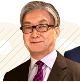
吉澤 英樹 西オーストラリア州 政府観光局 日本局長